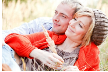
Suche die große Liebe